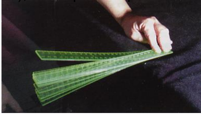
Imagen 2: Grafica de estudio de una onda ocupada por la Física.

Imagen 1. Toma una regla en el marco de una mesa y golpearla suavemente (aplicar una fuerza), notar que esto produce una vibración del objeto como muestra la imagen.