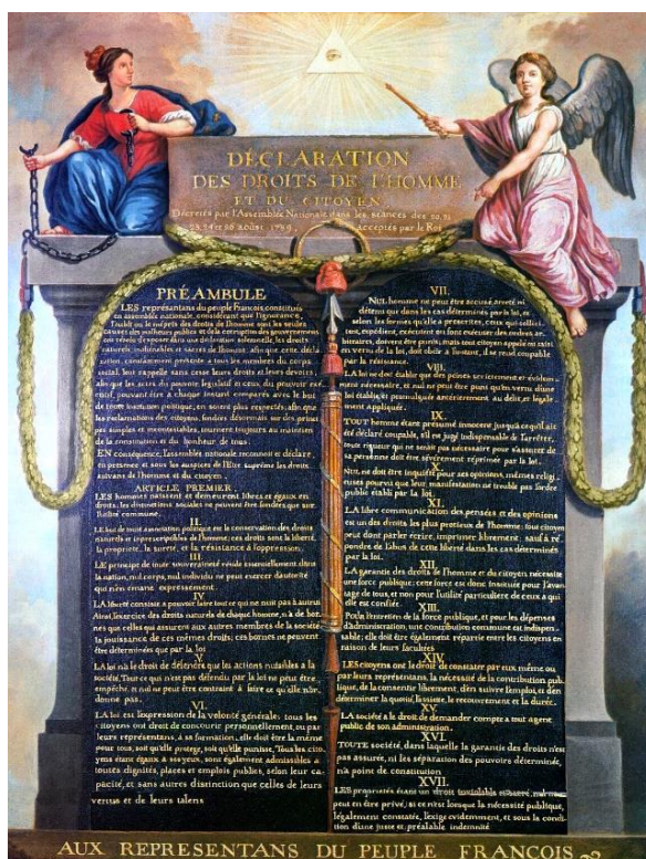
AUX REPRESENTANS DU PEUPLE FRANCOIS

A.4.- Libertad religiosa: este derecho otorga plena independencia para practicar cualquier religión o credo sin imposición previa.