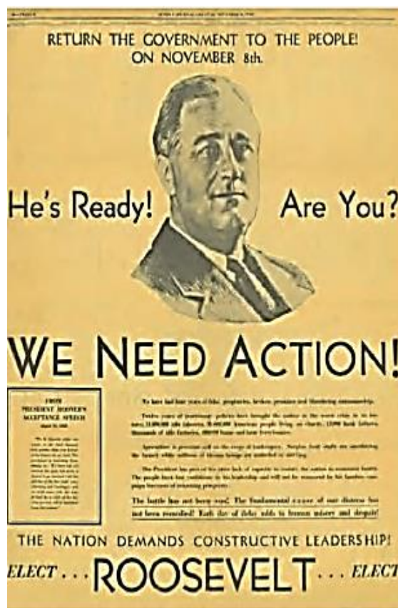
▲ Página de propaganda electoral publicada en el diario estadounidense Sunday Journal and Star el 6 de noviembre de 1932.

La mayoría de los países, comenzando por Estados Unidos, adoptaron medidas proteccionistas que impidieron a las demás naciones obtener dólares mediante la venta de productos de exportación. Entre 1929 y 1932, el comercio internacional se redujo en casi dos tercios respecto de los años anteriores a la crisis. La Gran Depresión se hizo mundial.