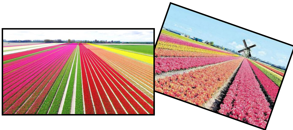
SEMBRADOS DE TULIPÁN EN HOLANDA

Los artistas de este estilo llevan al lienzo (soporte bidimensional) lo que ven en su entorno con especial detalle, utilizando la línea de contorno, las diferentes texturas que les ofrece el paisaje, el campo y sus sembrados en diferentes tonalidades y matices, convirtiendo el paisaje en cuadros de sembrados, montones de paja dispersas o amontonadas como enormes paralelepípedos en medio de los campos, podría decirse que la agricultura da bellos ejemplos de arte medioambiental y que el estilo Naif lo representa ingeniosamente en sus pinturas.